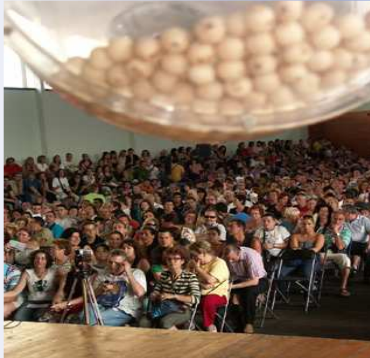
Sorteig de 108 habitatges entre 755 sol·licitants en una població catalana , 2008